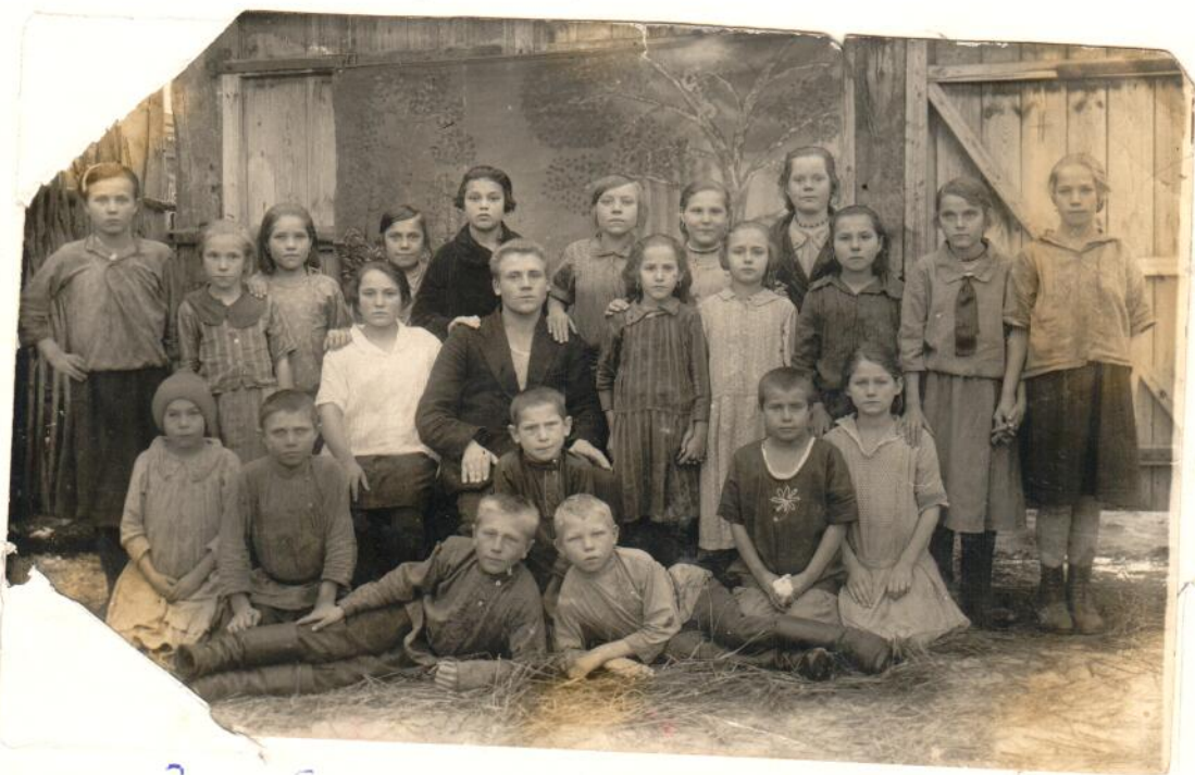
II и IV группы школы.