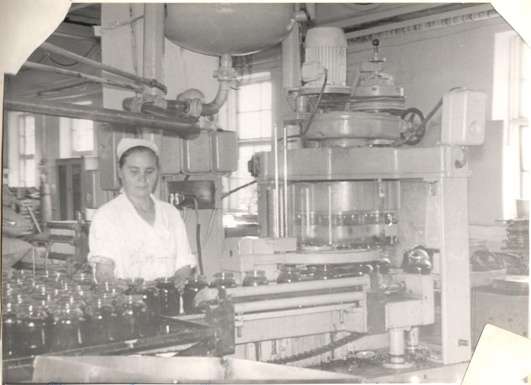
Женщина работает на заводе - закатывает