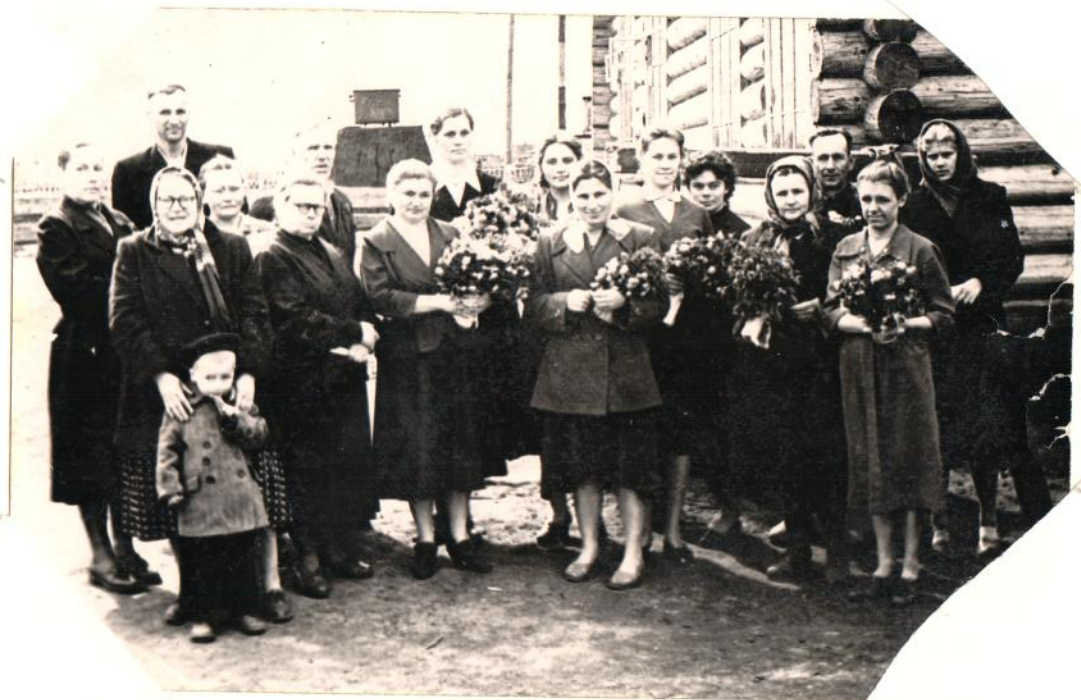
Комитет уштоқисеи школаси № 57.