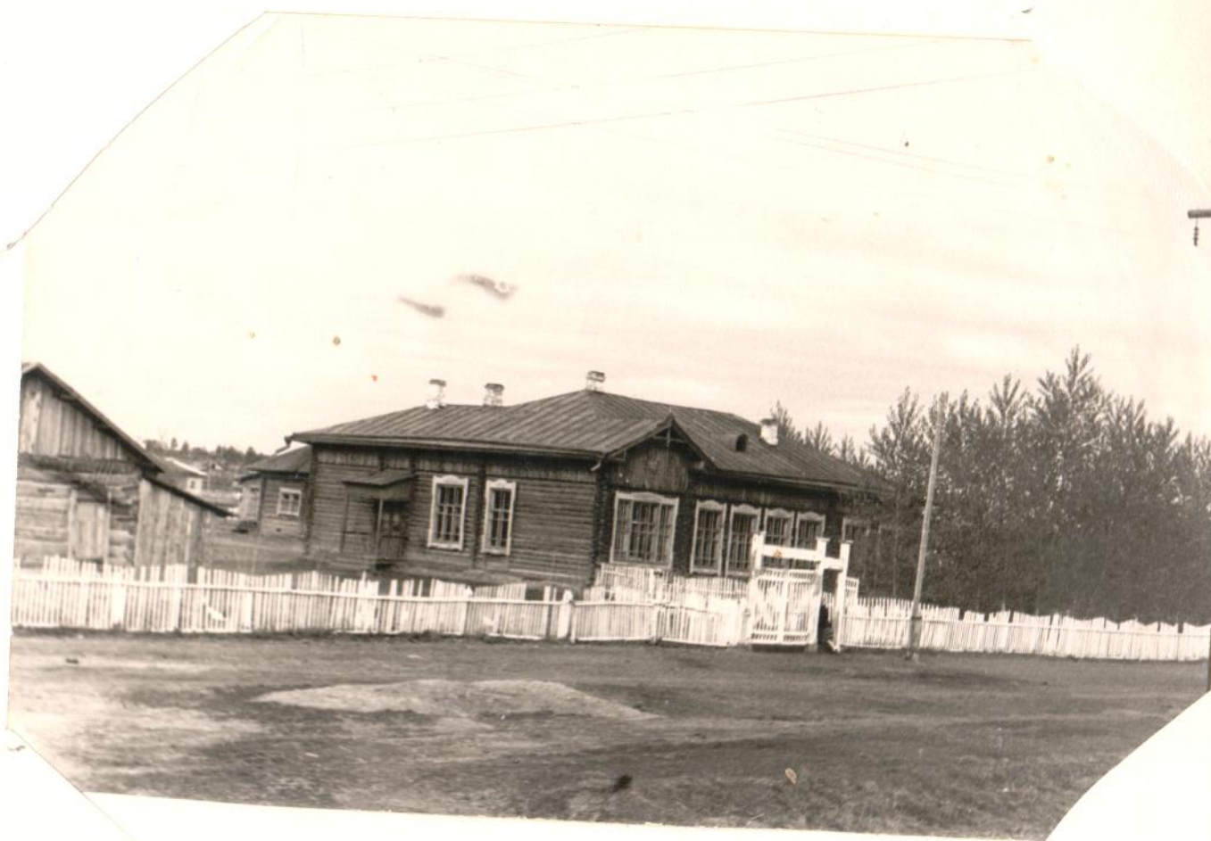
Школа № 57. Самая первая.