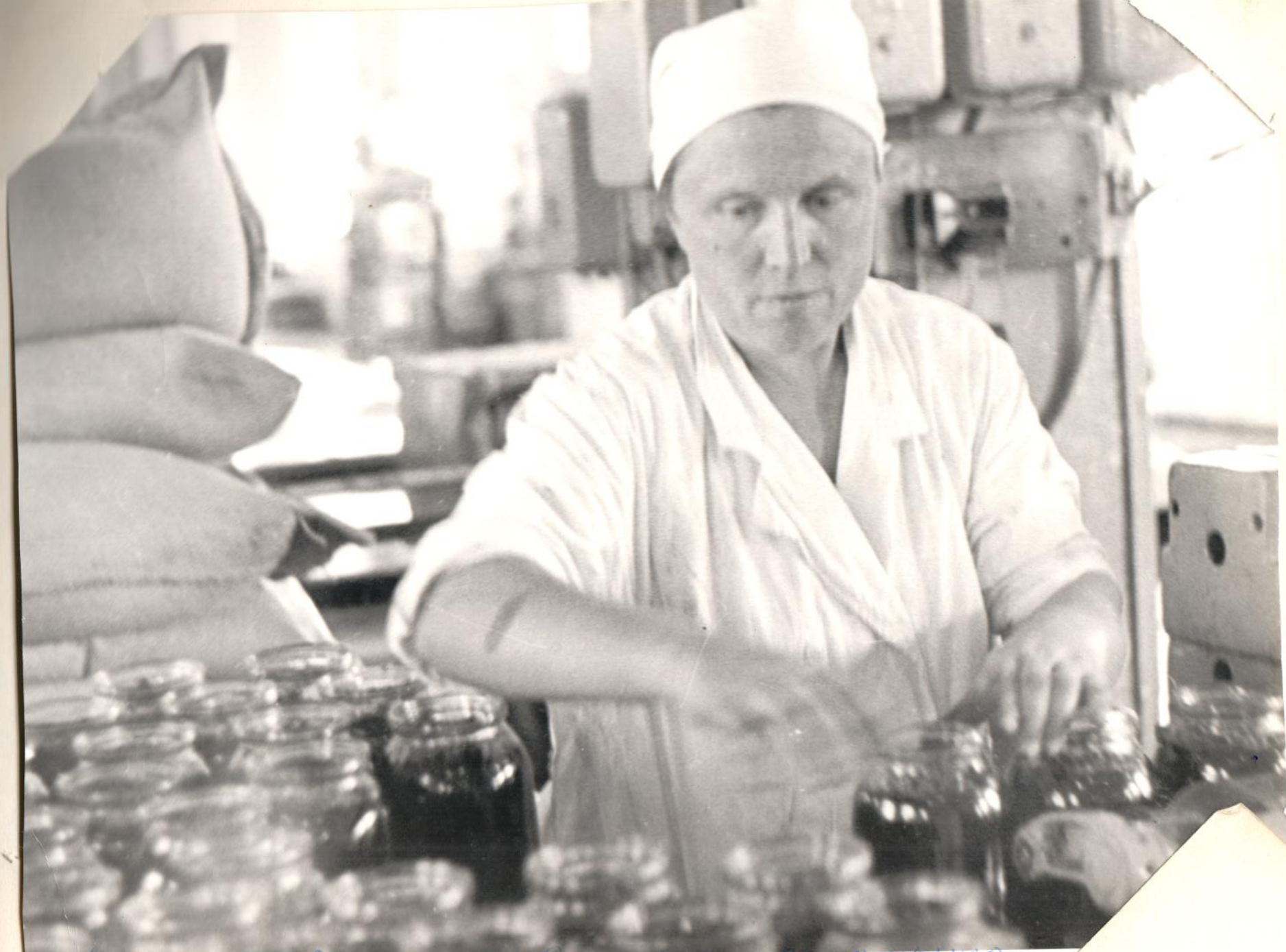
Кухонная Академия Вегетарианская - заготовка