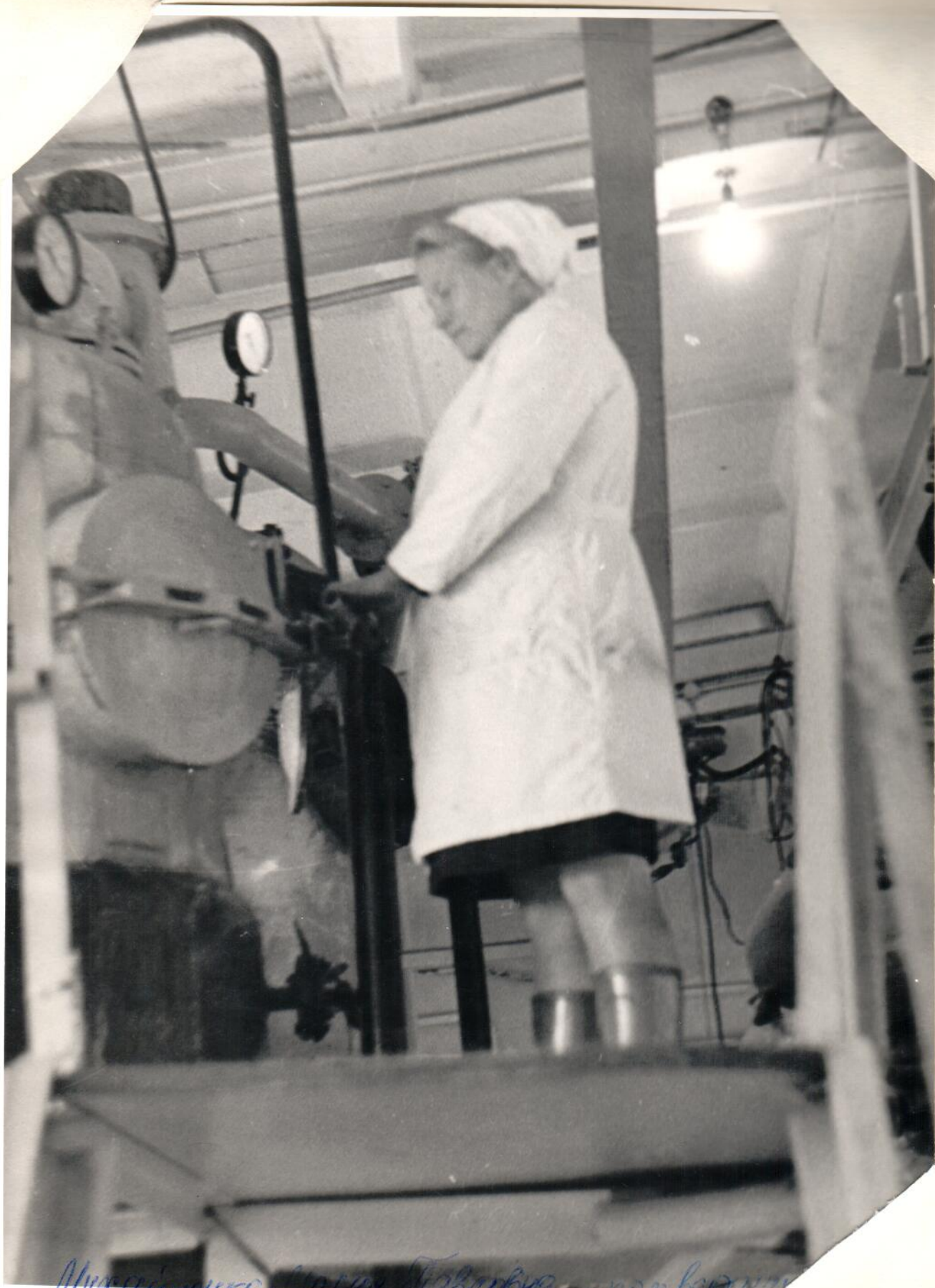
Машинистка фабрики в Ленинграде