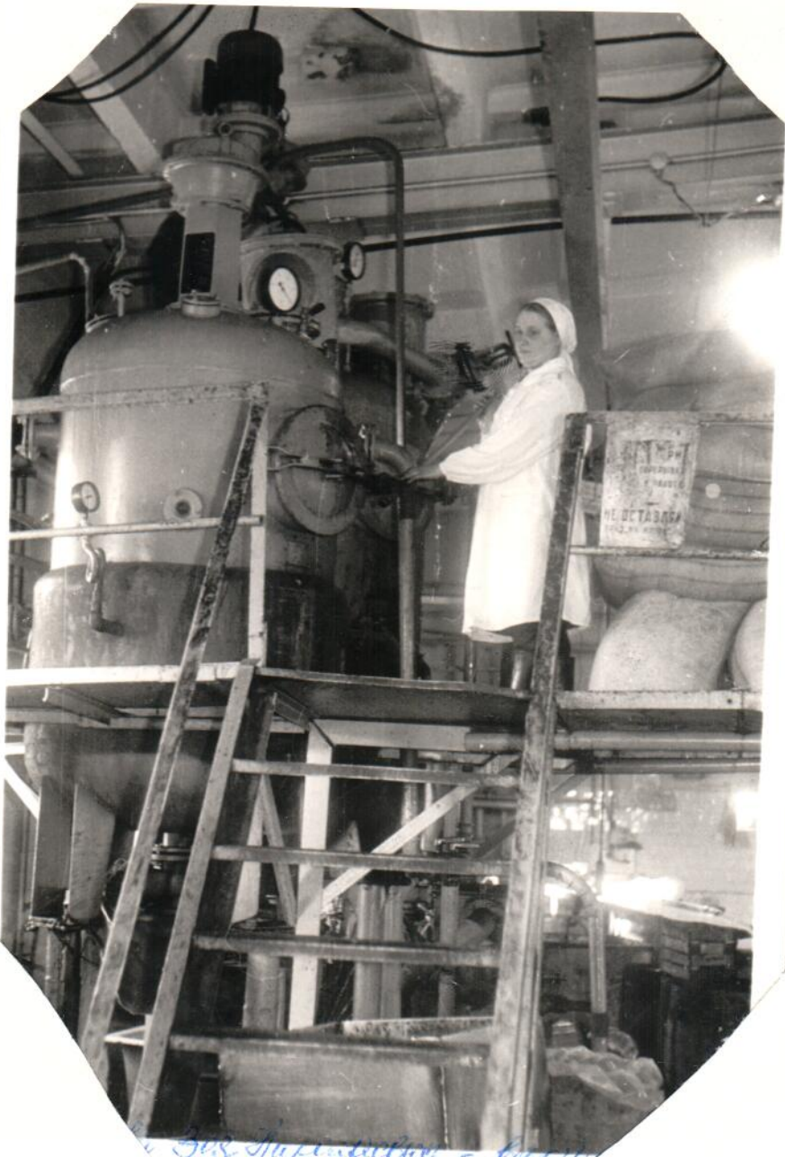
St. Nicholas - Co. N.Y.